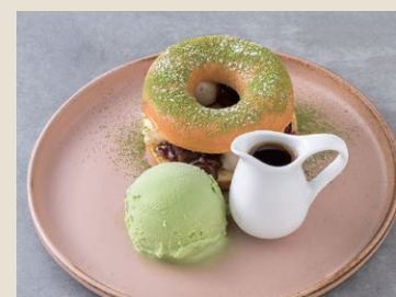
抹茶紅豆煉乳甜甜圈 180 抹茶白玉ドーナツ