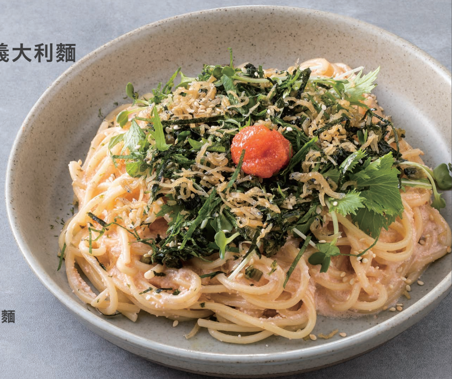
明太子奶油紫蘇義大利麵 明太子クリームパスタ 290