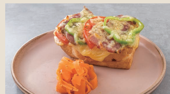
披薩吐司 180 ピザトースト