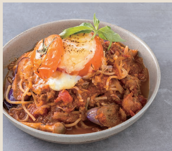
一顆番茄肉醬義大利麵 丸ごとトマトボロネーゼ 280