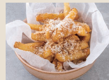
柴魚起司薯條 140 鰹節チーズポテト