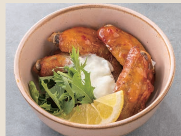
香辣烤雞翅 160 スパイシーチキンウイング