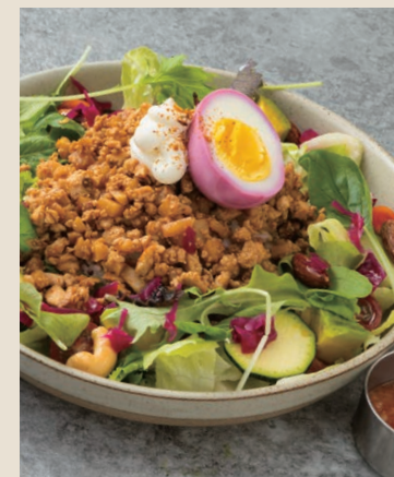
素塔可飯 蛋奶素 ベジタコライス 280