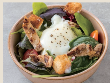
溫泉蛋凱薩沙拉 160 シーザーサラダ