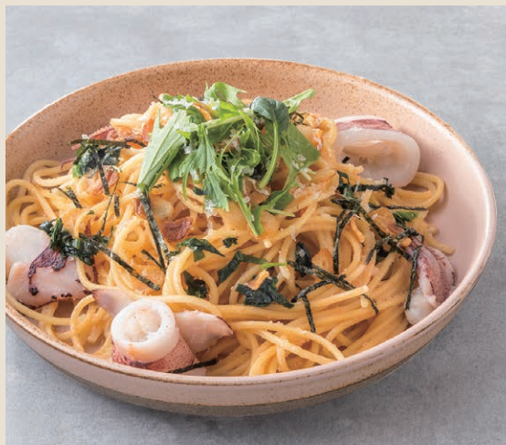
明太子花枝清炒義大利麵 明太子とイカの Pasta 320