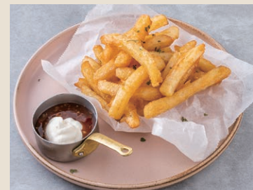
酸奶油甜辣醬薯條 140 チリソースポテト