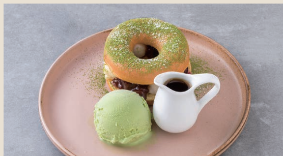
抹茶紅豆煉乳甜甜圈 180 抹茶白玉ドーナツ