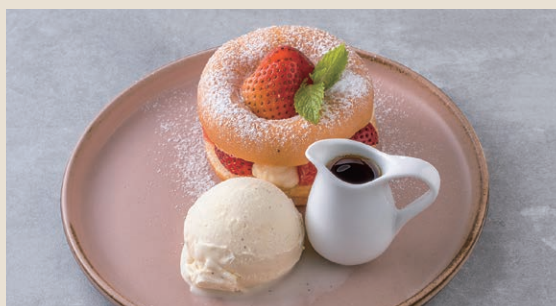
花園水果甜甜圈 180 フルーツドーナツ