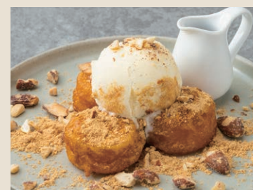
黃豆粉冰淇淋南瓜餅 180 黄な粉かぼちゃ餅