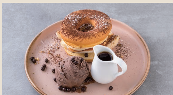
香蕉巧克力甜甜圈 180 チョコバナナドーナツ