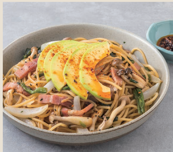
酪梨野菇醬油義大利麵 アボカド醬油パスタ 280