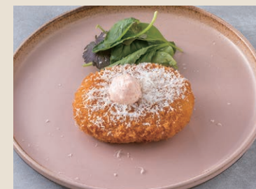
明太子起司可樂餅 120 明太子チーズコロケ