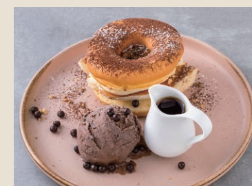
香蕉巧克力甜甜圈 180 チョコバナナドーナツ