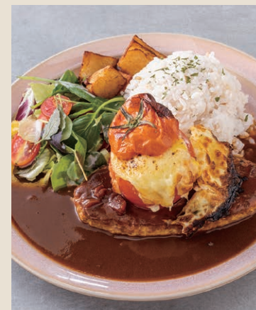
番茄紅醬漢堡排飯 デミグラスハンバーグプレート 340