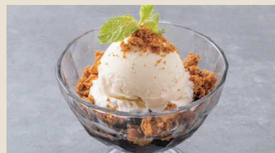
咖啡果凍冰淇淋 170 コーヒーゼリーアイス