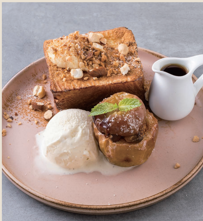
一顆蘋果焦糖法式吐司 220 アップルフレンチトースト