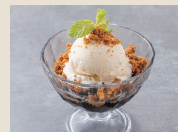
咖啡果凍冰淇淋 170 コーヒーゼリーアイス