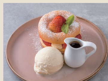
花園水果甜甜圈 180 フルーツドーナツ