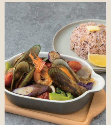
鹿兒島漁夫湯咖哩 鹿兒島出汁の海鮮スープカレー 460