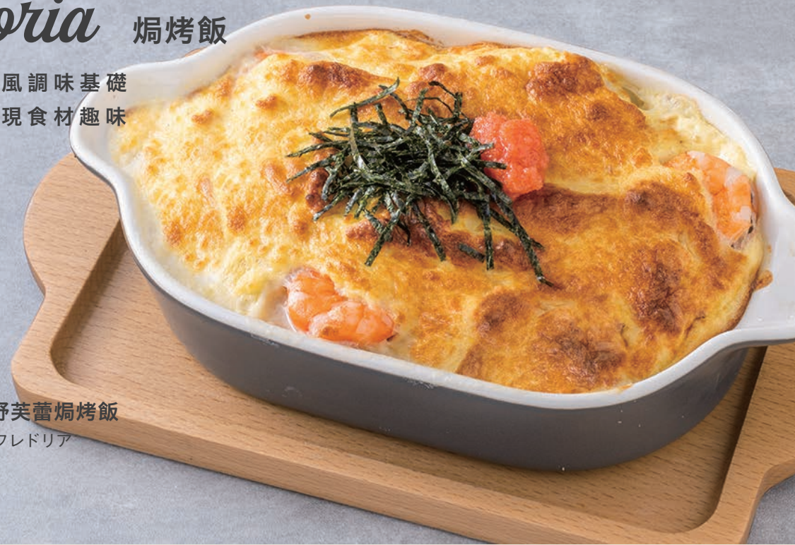
明太子舒芙蕾焗烤飯 明太子スフレドリア 320