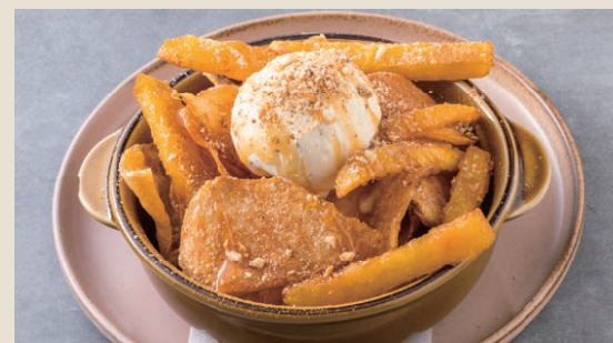
鹽味焦糖洋芋片 170 キャラメルソルトポテト