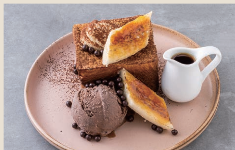
香蕉巧克力法式吐司 220 チョコバナナフレンチトースト