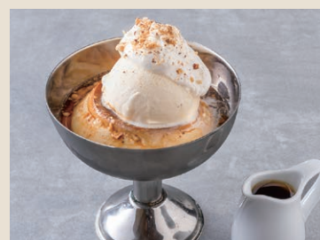
阿芙佳朵布丁 170 プリンアフォガード