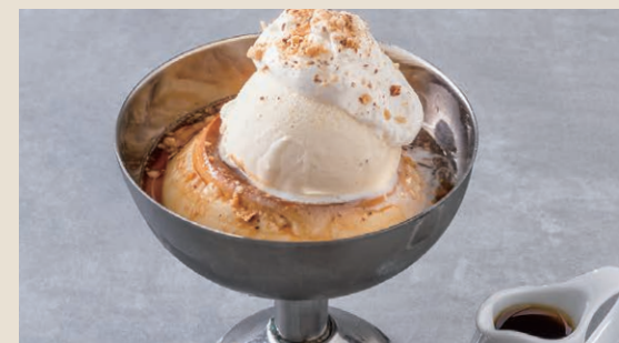
阿芙佳朵布丁 170 プリンアフォガード