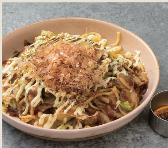
大阪燒風義大利麵 お好み焼き風パスタ 280