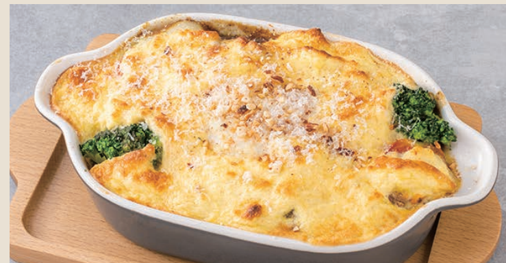
咖哩舒芙蕾焗烤飯 カレースフレドリア 290