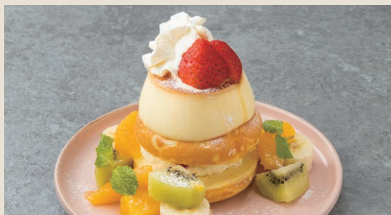
甜甜圈布丁百匯 260 ドーナツプリンアラモード