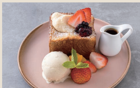
綜合莓果法式吐司 220 ベリーフレンチトースト