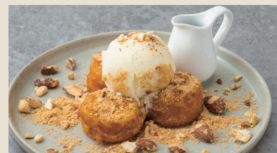
黃豆粉冰淇淋南瓜餅 180 黄な粉かぼちゃ餅