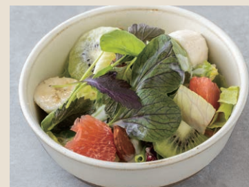
水果優格沙拉 140 ヨーグルトサラダ